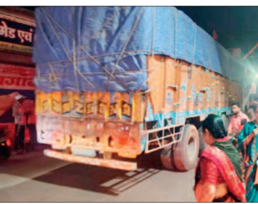
पास फिसलकर घायल हो गए। इससे पहले सोनपुर मोड़ पर भी कई लोग दुर्घटना का शिकार हो चुके हैं। लगातार हो रही इन घटनाओं ने लोगों में भय का माहौल पैदा कर दिया है। स्थानीय लोगों का कहना है कि सड़क की नियमित सफाई नहीं होने और अक्सर नियंत्रण खो बैठते हैं। हाल ही में तरीघाट निवासी एक दंपति भाटा बड़ी के

अभनपुर से पाटन राजमार्ग पर इन दिनों सड़क के मोड़ों पर बिखरी रेत, गिट्टी और सीमेंट दुर्घटनाओं का बड़ा कारण बनते जा रहे हैं। ओवरलोड ट्रकों से गिरने वाली निर्माण सामग्री के चलते दोपहिया वाहन चालकों की जान जोखिम में पड़ रही है। मोड़ों पर विशेष रूप से यह समस्या अधिक गंभीर हो जाती है, जहाँ संतुलन बिगड़ने के कारण वाहन चालक फिसलकर चोटिल हो रहे हैं।